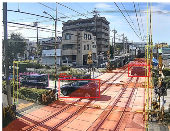
AI画像解析装置により物体を検知している様子（イメージ）

このような状況に対して、交通に関わる事業者が互いに協力し、AI画像解析を活用した事故を未然に防ぐシステムの構築を目指し、踏切の安全性を向上するための仕組みを導入します。